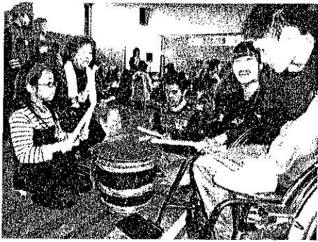
この街に生きて・・・ 福祉の文化祭に参加しました。