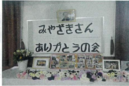
題字は、なかまの手作り