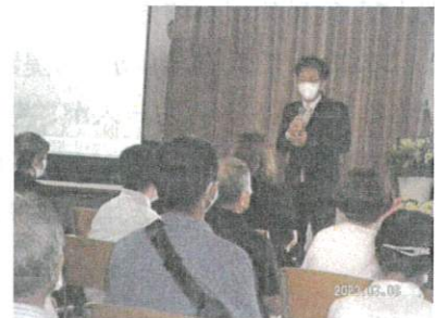
ご長男よりごあいさつを頂きました